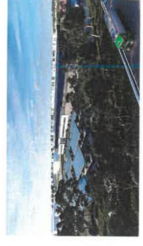
PLAN 35m - ZONE B